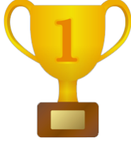
Genel Sınav Grafiđi - Melek ÇİMEN